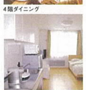
単身用居室(家具類は一例)